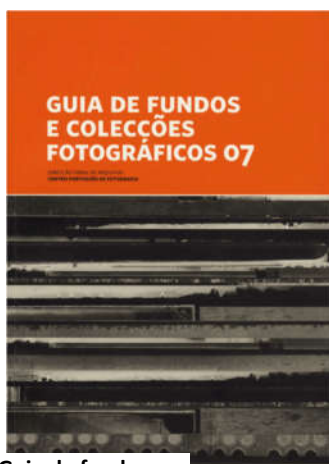
Ilustração 2 - Guia de fundos fotográficos

A publicação dos guias de fundos e colecções continuou, desta vez dedicado a um tipo muito específico de documentos: a fotografia. Neste volume, editado em 2007, foram reunidas as