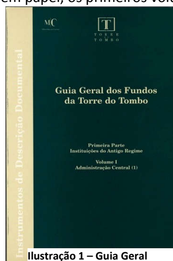
Ilustração 1 - Guia Geral

Privilegiados foram aqueles a quem foi proporcionado colaborar neste projecto concretizado entre 1996 e 2005, particularmente porque foi um dos primeiros trabalhos, em Portugal, a ser desenvolvido conforme as normas internacionais de descrição em arquivo, as ISAD (G).