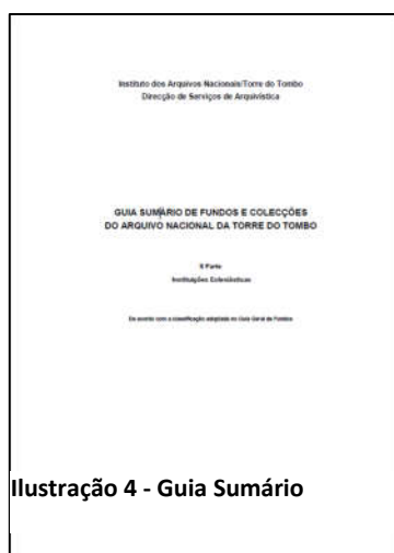
Ilustração 4 - Guia Sumário

Neste guia sumário as instituições estão organizadas pelo seu tipo: as seculares, onde se encontram os fundos das dioceses, das igrejas, das colegiadas, das irmandades; as regulares, aquelas que estavam sujeitas a uma regra, a uma ordem, ou seja, genericamente os mosteiros e os conventos; e as colecções, como a Colecção Especial e o Armário Jesuítico.